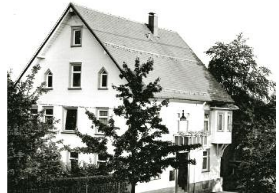
Firmengebäude in der Bahnhofstraße, Freudenstadt

Der junge Firmeninhaber besaß seit 1924 ein Auto, es soll laut Überlieferung das erste Fahrzeug dieser Art in Freudenstadt gewe-sen sein. Infolge von Inflation, Reparationsleistungen und einem unzureichenden Straßennetz hatte sich in Deutschland die Nachfrage nach Automobilen in den 20er Jahren nur schlep-pend entwickelt.