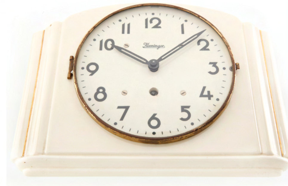
Küchenuhr von 1927, eines der ersten Uhrenmodelle aus dem Hause Kieninger Kitchen clock from 1927, one of the first clock models of the company Kieninger.