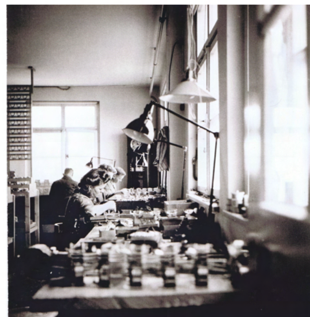
Die Fertigung im Jahr 1928 The production in the year 1928