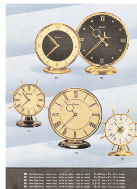
Stiluhren Modelle 310 bis 314 aus dem Katalog 1953 Table top clocks model 310 to 314 from the catalogue of 1953