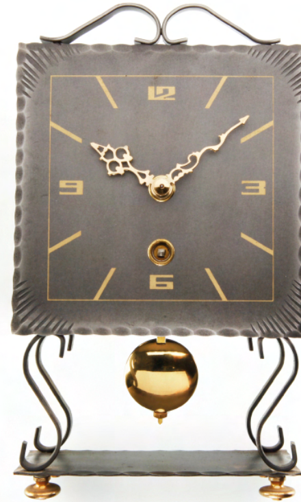
Metall-Stiluhr aus den 50er Jahren Metal table top clock from the 50ies

In the first few years after the war there was a lack of everything, not only of living space but also of food, tools and material. But after the currency reform in 1948 things finally started to become better. The economy gradually recovered. As part of the recovery program in the 50's more than half a million new flats were built every year. People were in need of furniture - and clocks, of course.