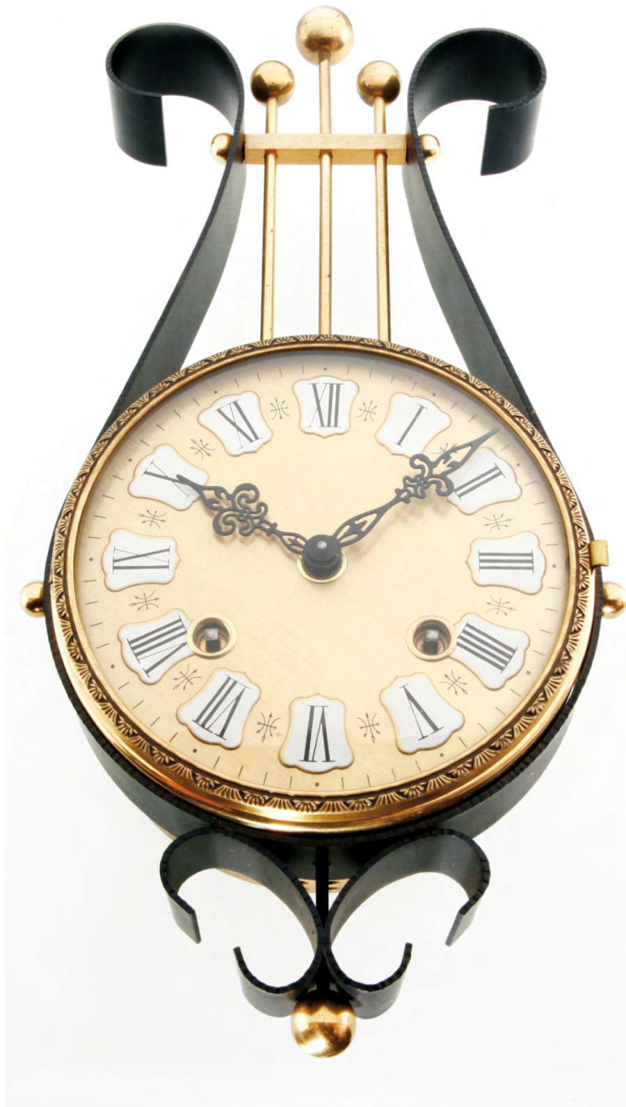
Wanduhr im Lyrastil aus den 50er Jahren Lyra shape wall clock from the 50ies

In den ersten Nachkriegsjahren herrschte überall großer Mangel, nicht nur an Wohnraum, sondern auch an Nahrungsmitteln, Werkzeugen und Material. Nach der Währungsreform 1948 ging es endlich wieder aufwärts. Die Wirtschaft kam wieder in Schwung. Im Rahmen des Wiederaufbaus wurden in den 50er Jahren pro Jahr mehr als eine halbe Million neue Wohnungen gebaut. Die Menschen brauchten Möbel - und natürlich auch Wohnraumuhren.